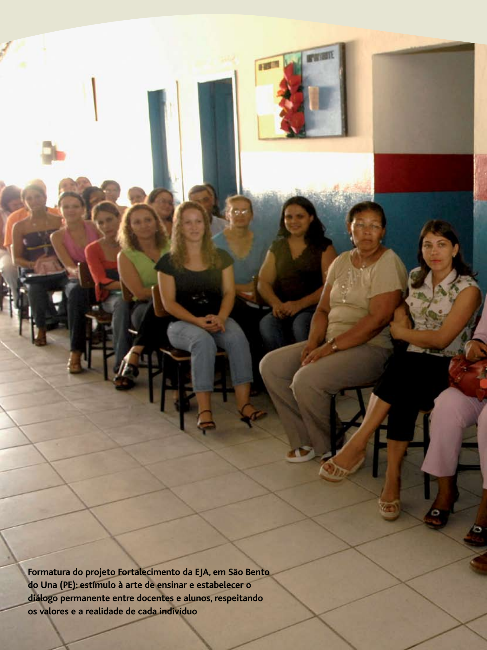
Formatura do projeto Fortalecimento da EJA, em São Bento do Una (PE): estímulo à arte de ensinar e estabelecer o diálogo permanente entre docentes e alunos, respeitando os valores e a realidade de cada indivíduo